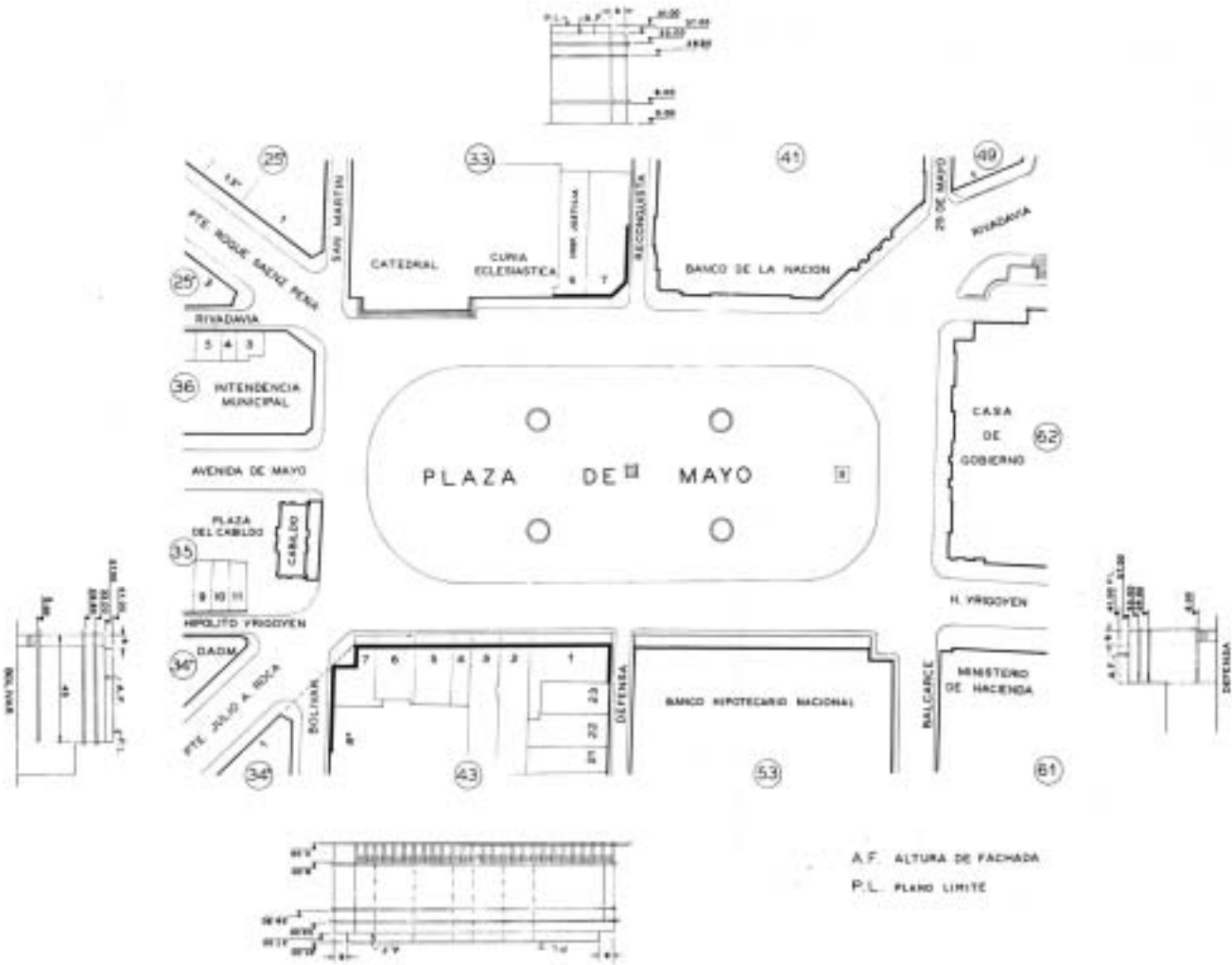
PLANO AE8 PLANO Nº 5.4.7.8

Edición Actualizada al: 31 de diciembre de 2002.